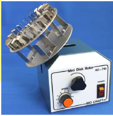
※回転ホルダーは別売です。